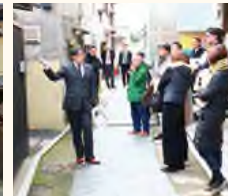
銀行員による歴史的建築物の説明