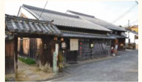
奈良町の町家のある町並み

南都銀行の呼びかけにより、同じ悩みを持つ奈良市との打ち合わせが始まった。「民間事業者を対象とする町家見学ツアーの実施」というアイデアは比較的早い段階で出てきたものの、その実現に向けては、「どれだけの物件を集められるのか」、「どうすればツアー参加者に町家の事業化イメージを持ってもらえるか」などの課題を半年ほどの時間をかけて一つひとつクリアする必要があったという。