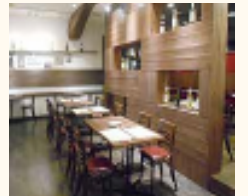
町家の趣きを活かした内装