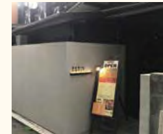
見学ツアーにより誕生した飲食店