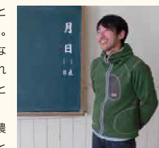
合同会社「WOULD」 多田代表