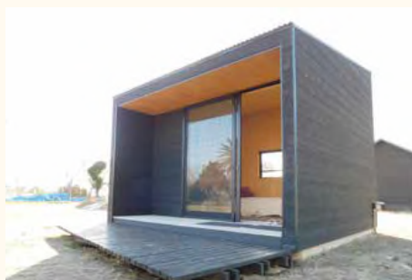
旧校庭に並ぶ「小屋」の外観

大学の研究室や、サーフショップも入居している。「海がすぐ近くにあるので、早朝にサーフィンを楽しんでから、仕事モードに入る。そういうオフとオンが一体となった働き方も可能です」